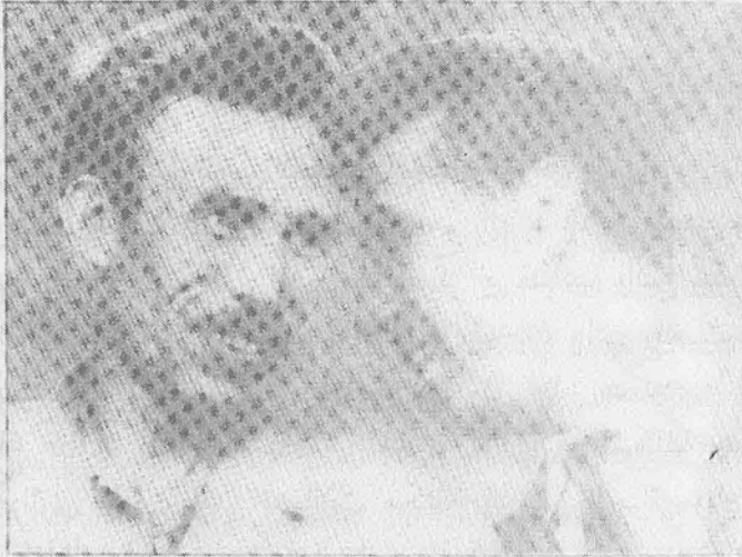
الرئيسان الجزائريان أحمد بن بلة والهواري ابومدين